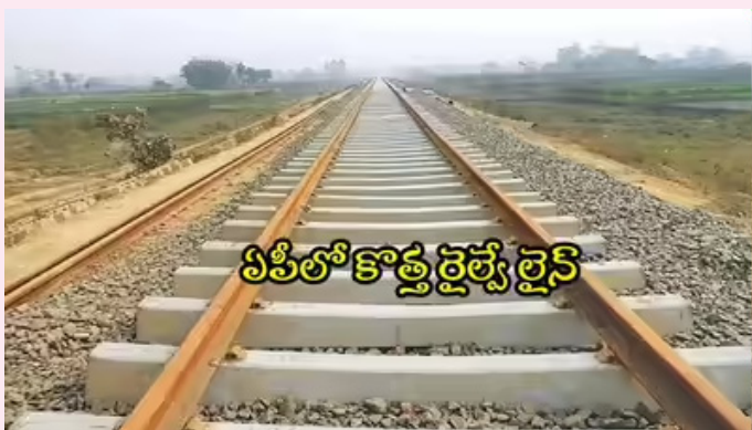
ఏపీలో కొత్త రైల్వే లైన్

ఏపీలో కొత్త రైల్వే లైన్ కు సంబంధించి కేంద్రానికి రిక్వెస్ట్ వెళ్లింది. కడప నుంచి బెంగళూరుకు కొత్త రైలు మార్గంపై రాజమహేంద్రవరం ఎంపీ దగ్గుబాటి పురందేశ్వరి రైల్వేమంత్రి అశ్వినీ వైష్ణవ్ కు వినతిపత్రాన్ని అందజేశారు. ఈ రైల్వే లైన్ రాయలసీమ అభివృద్ధికి కీలకమైనదని పురందేశ్వరి